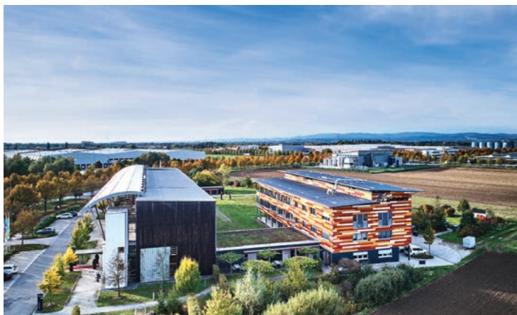
Start-up-Space im BioCubator, Bayerns einzigem Unternehmerzentrum für Nachwachsende Rohstoffe.

Die genauen Termine und Details zum Coaching sowie zur Prämierungsveranstaltung auf www.planb-wettbewerb.de